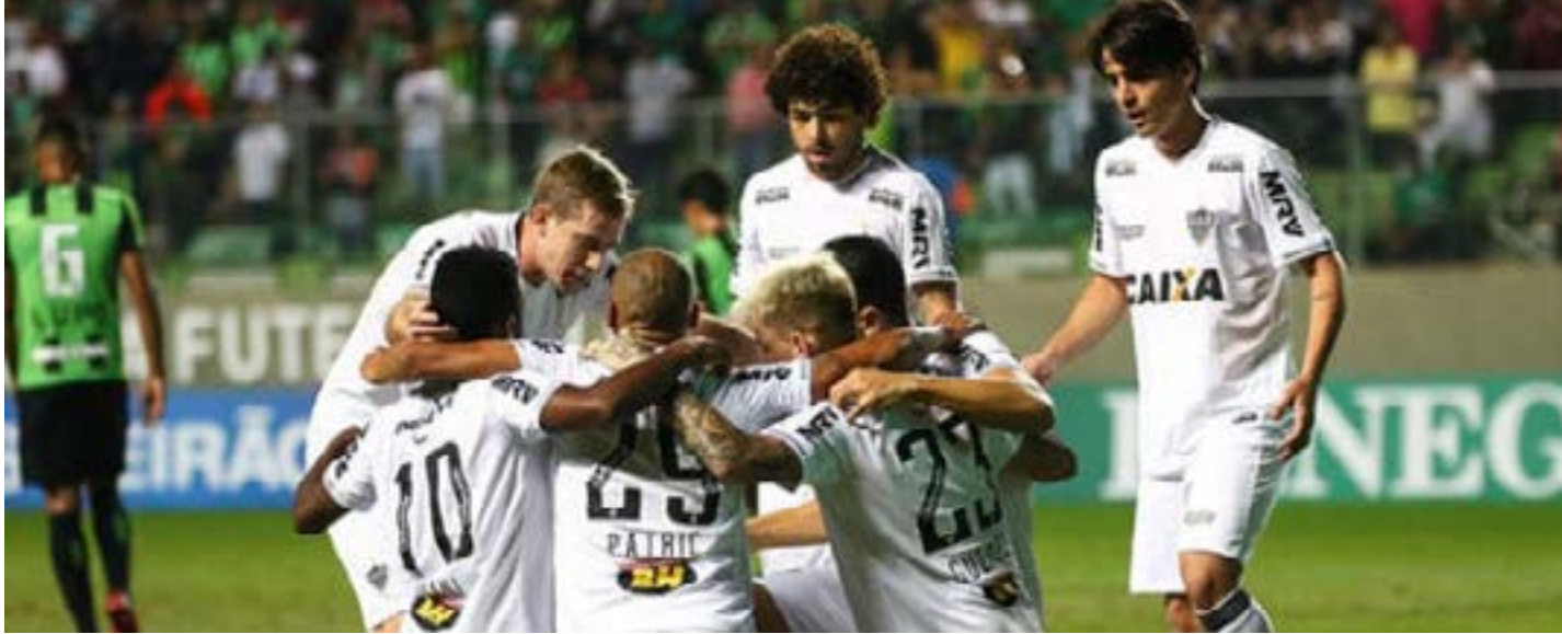
Atlético vence América por 3 a 1 e volta para o G-4 do Brasileiro

A tlético vence América por 3 a 1 no Independência, sobe da 9ª para a 4ª colocação no Brasileiro e ultrapassando seu rival Cruzeiro. Ricardo Oliveira, Cazares e Tomás Andrade marcaram os gols para o Galo e, Messias, fez o de honra do Coelho.